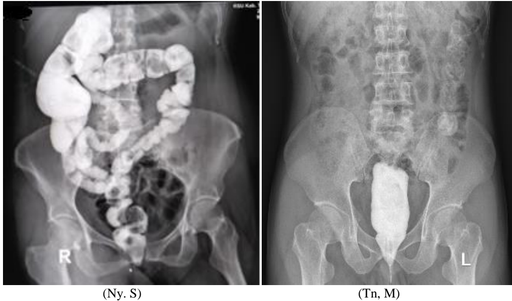
Gambar 2. Proyeksi AP Dengan Kontras Media (Radiologi RSUD Kab. Tangerang, 2019)