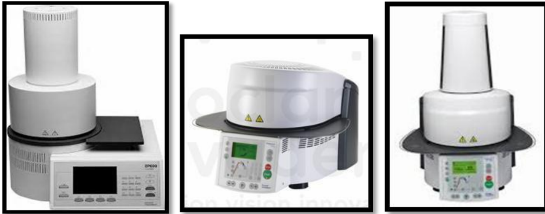
Gambar 4. Alat Programat

Alat yang digunakan dalam pembuatan labial veneer all porcelain dengan metode press dapat dilakukan dengan beberapa macam alat, antara lain yaitu menggunakan alat Programat EP 600 adalah salah satu jenis mesin yang dirancang untuk menekan ( press ) ingot IPS E-max press serta pembakaran ( firing ) dental ceramics materials dan hanya boleh digunakan untuk tujuan tersebut saja. (11)