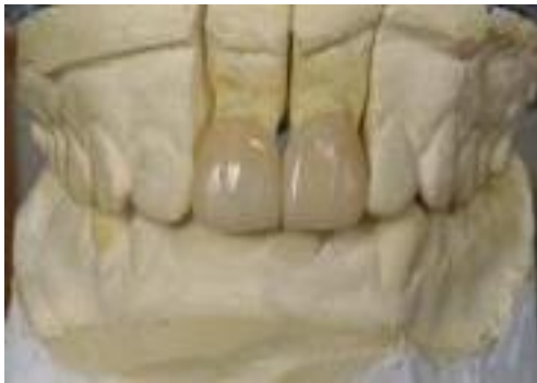
Gambar 8. Hasil

central tertutup rapat sehingga membentuk kontak bidang dengan gigi sebelahnya; 2). Permukaan labial terlihat seperti gigi asli; 3). Tepi labial veneer kontak rapat dengan tepi gigi yang di preparasi ; 4). Permukaan halus dan mengkilap ; 6).Estetik baik . Tampak hasil dari proses ditunjukkan pada Gambar 8.