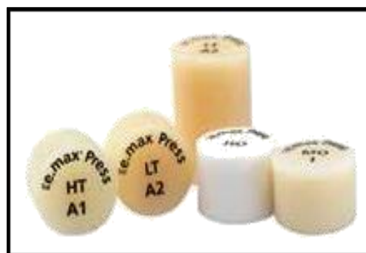
Gambar 3. Ingot E-max Press

Macam-macam all porcelain E-max press , terdiri dari E-max press polychromatic yang merupakan salah satu bahan ingot yang memiliki gradasi warna tersendiri dalam satu ingot . dan E-max press monochromatic yang tersedia dalam 2 ukuran dan 5 level translusensi yang berbeda, yaitu: HT ( high translucency ), MT ( medium translucency ), LT ( low translucency ), MO ( medium opacity ), HO ( high opacity ). (10)