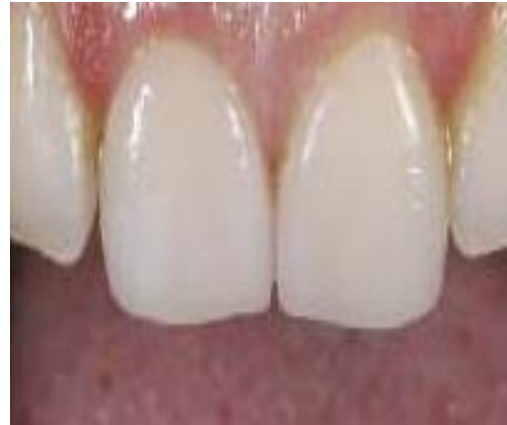
Gambar 2. Labial Veneer

memperbaiki estetika. Karena labial veneer merupakan lapisan tipis pada permukaan