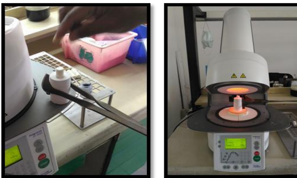
Gambar 6. Pressing lapisan dasar

bagian wax melebihi batas preparasi. Lapisan kedua menggunakan servical wax pada bagian servical dengan cara di ulasi dan yang ketiga menggunakan wax organik dengan cara mengulasi pada seluruh permukaan labial atau bagian body dengan ketebalan minimum 0,5-0,8mm.; 5). Spruing , yaitu pemasangan sprue pada pola malam yang telah selesai dibuat; 6). Investing ; 7). Preheating 8). Pressing , dengan cara IPS e-max plunger dan ingot e-max diberi separator ( alox plunger separator ) berupa powder agar pada saat divesting ingot tidak menempel pada plunger . Kemudian investment ring dikeluarkan dari preheating furnice untuk melakukan proses pressing . Selanjutnya menyalakan mesin furnace EP 3000 dengan menekan tombol berwarna hitam yang terdapat di belakang mesin, lalu Ingot dimasukkan ke dalam mould space investment ring yang sudah dilakukan preheating dan meletakkan alox plunger diatas ingot pada mould space , kemudian dilakukan pressing dengan menggunakan alat Programat EP 3000.; 9). Divesting ; 10). Cutting sprue .