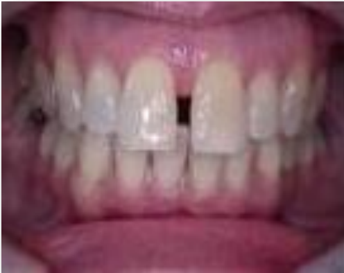
Gambar 1. Diastema Central

terdapat di anterior . Adanya ruang antara dua gigi yaitu gigi incisivus pada rahang