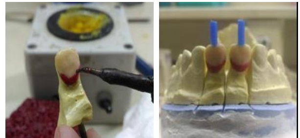
Gambar 5. Wax up dan spruing

Tahap yang dilakukan dalam pembuatan lapisan dasar ini, (Gambar 5 dan 6) yaitu: 1). Penerimaan Studi Model; 2). Persiapan model kerja; 3). Pembuatan die dengan pindex system untuk dibuatkat tempat pin ;